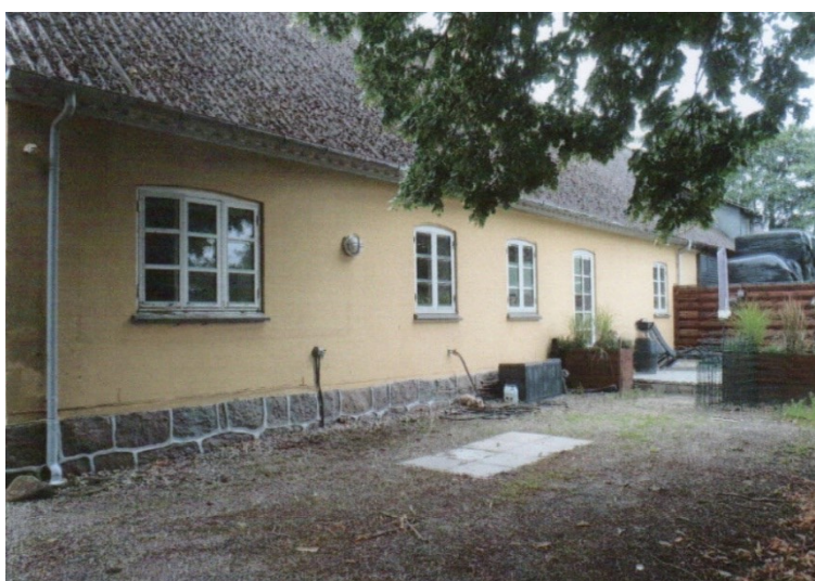
Figur 2. Viser boligens facade ud mod vejen.