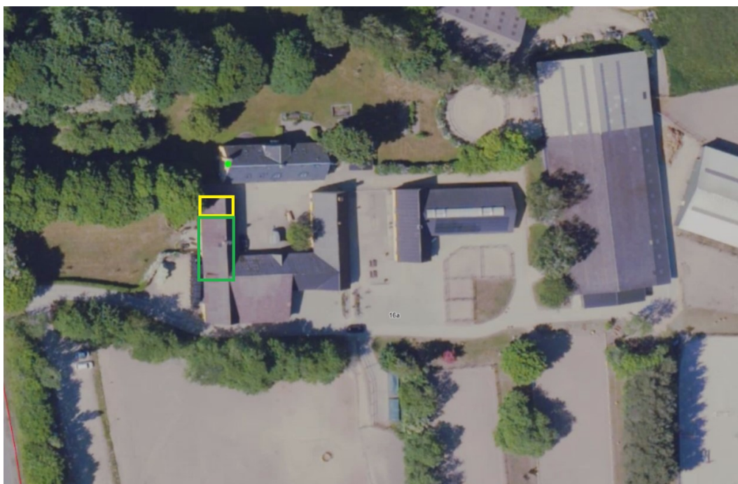
Figur 1. oversigtskort der viser ejendommen. Den oprindelige bolig på 110 m 2 indrettet efter planlovens § 37 er markeret med grøn, mens udvidelsen af boligen er vist med gul.