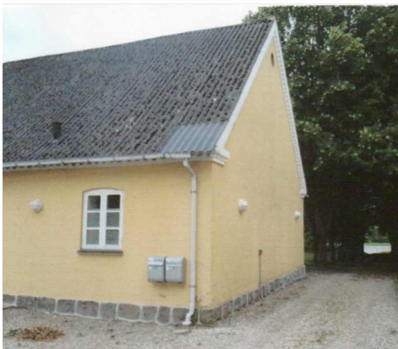
Figur 3. Viser gavl og facade af boligen ind mod gårdspladsen, i den del som tidligere var vognport.